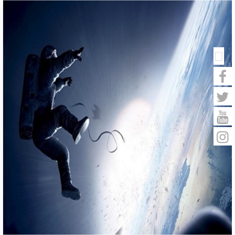
Directores que debería ver —alguna vez en la vida—